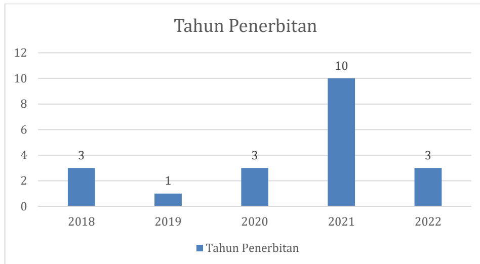
Rajah 2: Trend kajian berdasarkan tahun (2018- April 2022)