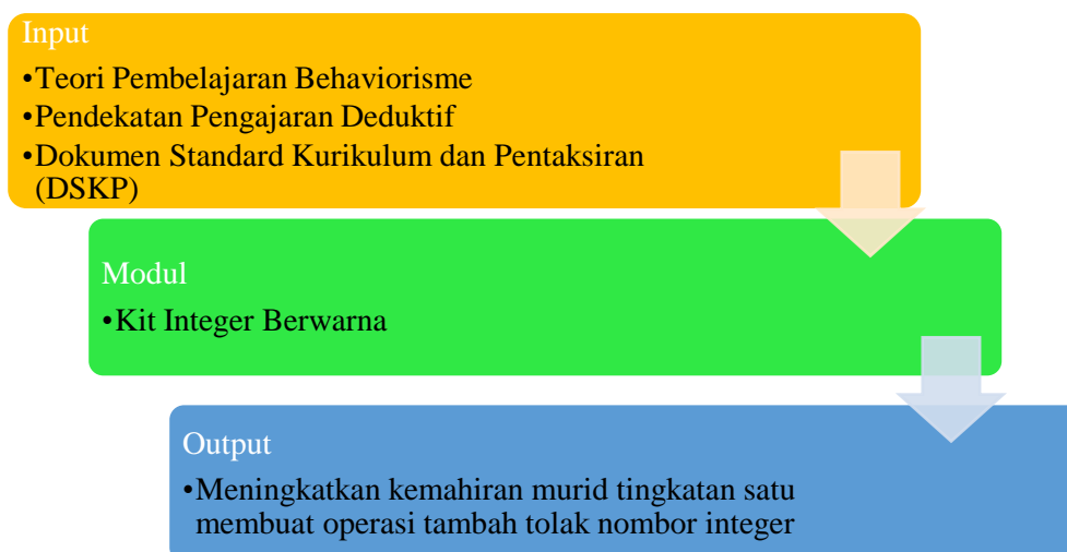
Rajah 1: Kerangka konsep kajian

Berdasarkan sorotan literatur yang telah dibincangkan, pengkaji telah membina kerangka konsep kajian sebagaimana yang telah ditunjukkan pada Rajah 1. Kerangka konsep menunjukkan teori pembelajaran behaviorisme akan digunakan untuk memerhati dan merangsang tingkah laku murid dalam penggunaan kit semasa proses pembelajaran. Penggunaan kit pengajaran ini menggunakan warna untuk merangsang tindak balas murid terhadap perbezaan nombor negatif dan positif. Pendekatan pengajaran deduktif diaplikasikan dalam modul di mana pengajaran bermula daripada umum kepada spesifik. Kaedah pengajaran berbentuk permainan yang digunakan untuk proses pengajaran dan pembelajaran. Kit pengajaran ini menggunakan warna untuk membezakan nombor integer. Nombor integer positif (+) akan menggunakan warna hijau manakala untuk nombor integer negatif (-) akan menggunakan warna merah. Proses pembelajaran akan dimulakan dengan pengenalan konsep nombor integer menggunakan contoh sebenar. Sebuah video pengenalan tentang topik integer akan ditayangkan kepada murid untuk tujuan memberi pemahaman secara teori kepada murid. Murid juga akan ditayangkan sebuah video tentang berkaitan dengan pengenalan terhadap kit pengajaran. Setelah itu, murid akan dibimbing oleh guru untuk menyelesaikan satu soalan matematik. Rajah 1 menunjukkan kerangka konsep yang telah dibina oleh pengkaji dengan menyatakan input, modul dan output kajian ini.