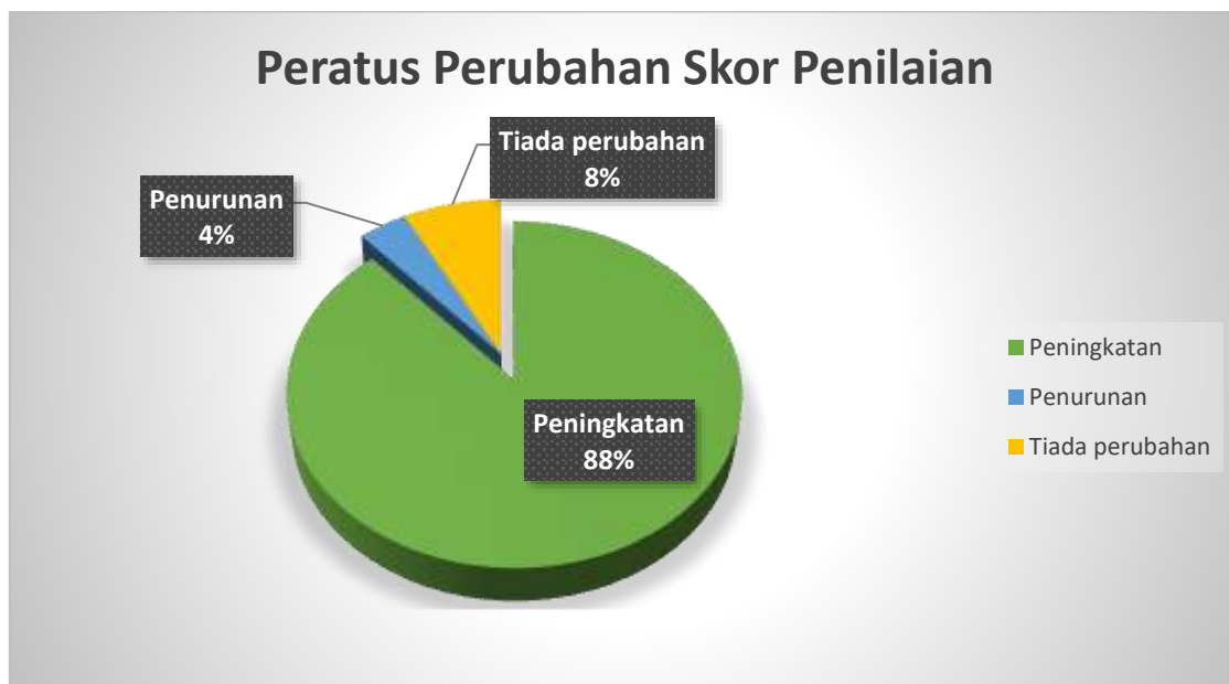
Rajah 4: Graf peratus perubahan markah penilaian murid

Hasil kajian ini diperolehi daripada skor penilaian murid sebelum dan selepas proses pengajaran menggunakan kit pengajaran tersebut. Berdasarkan skor penilaian murid, jelas terdapat perbezaan jumlah skor murid sebelum dan selepas. Terdapat 23 orang murid iaitu 88.47% jumlah murid mampu meningkatkan jumlah skor penilaian dengan baik. Manakala, 2 orang murid iaitu 7.7% daripada jumlah murid menunjukkan tiada perubahan dan seorang murid 3.85% menunjukkan penurunan skor penilaian. Perubahan skor markah penilaian murid menunjukkan peningkatan majoriti murid yang mengikuti pengajaran menggunakan kit yang telah dibina. Rajah 4 menunjukkan peratus perubahan skor penilaian murid yang terlibat dalam kajian ini.