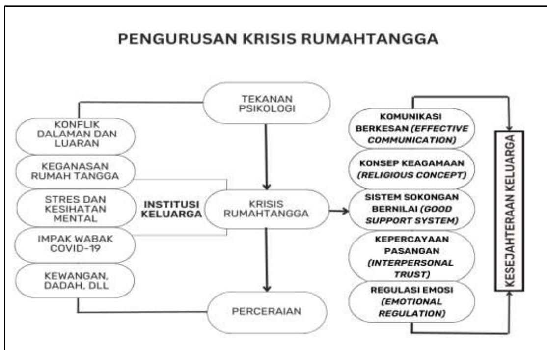
Rajah 2: Pengurusan krisis rumah tangga

Rajah 2 menunjukkan gambaran secara menyeluruh berkaitan punca krisis rumah tangga yang sering berlaku dan cara untuk menguruskannya dalam mengelakkan perceraian. Rajah tersebut menunjukkan krisis yang sering berlaku dalam institusi keluarga seperti konflik dalaman dan luaran, keganasan rumah tangga, stres dan kesihatan mental, impak wabak COVID-19, kewangan, dadah dan lain-lain. Krisis tersebut dapat membawa kepada tekanan psikologi seterusnya perceraian sekiranya ia tidak ditangani. Antara cara untuk menguruskan krisis rumah tangga adalah dengan menggunakan komunikasi berkesan ( effective communication ), konsep keagamaan ( religious concept ), sistem sokongan bernilai ( good support system ), kepercayaan pasangan ( interpersonal trust ), dan regulasi emosi ( emotional regulation ). Melalui pengurusan krisis yang tepat akan membawa kepada kesejahteraan keluarga.