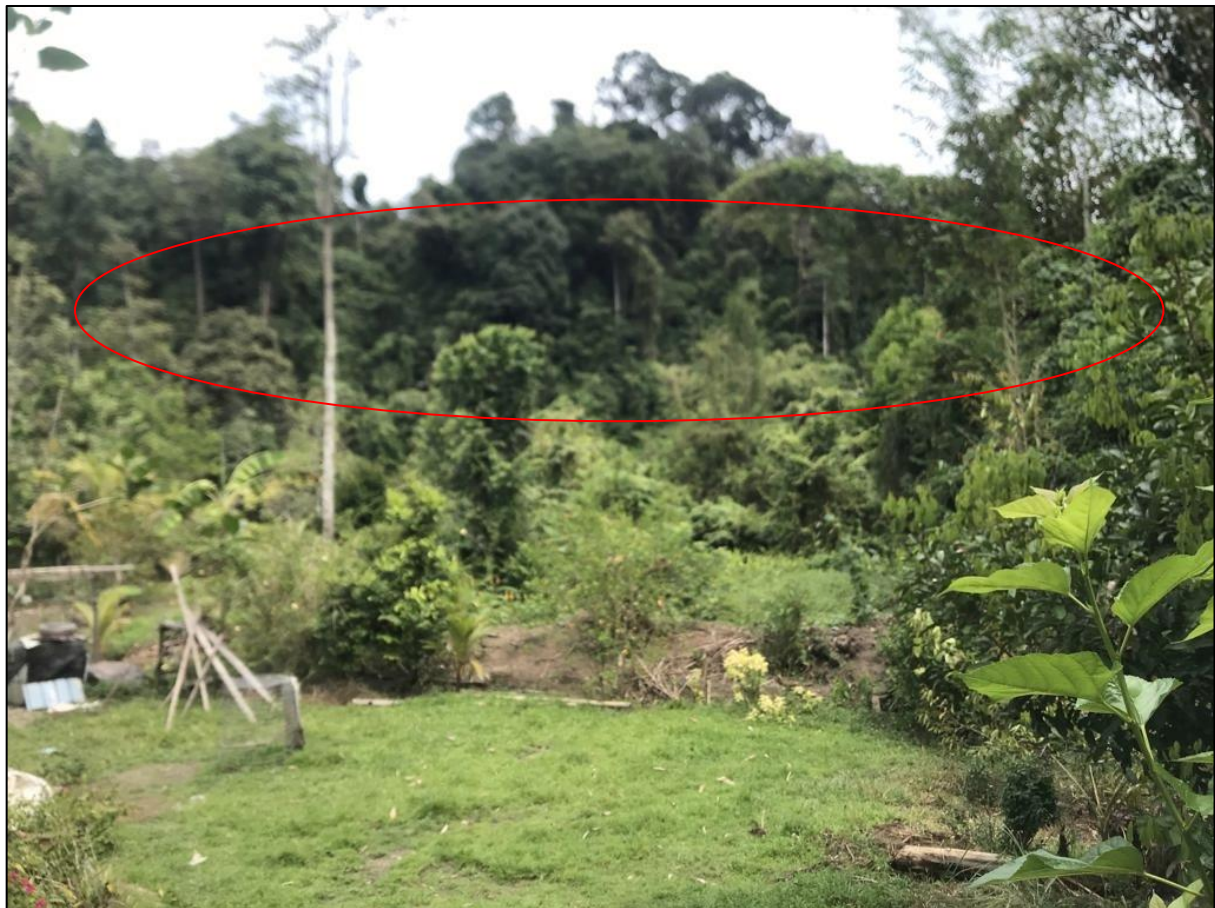
Gambar 1: Kawasan Tanah Runtuh di Kampung Nelumad