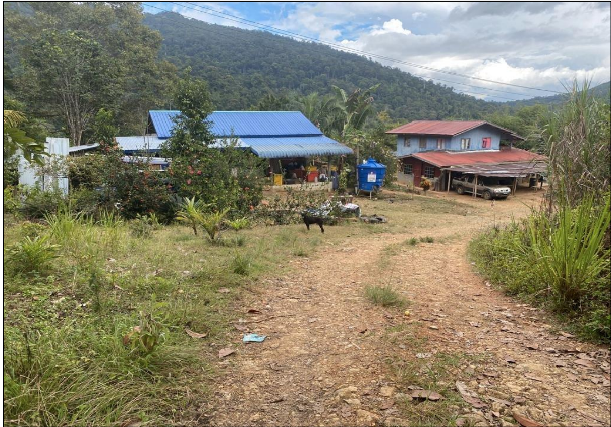
Gambar 4: Rumah penduduk di Kawasan Lakang

Sumber: Kajian Lapangan Kg. Nelumad, 10/12/2022