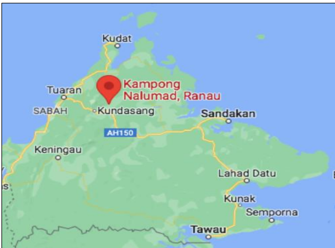
Peta 1: Kedudukan Kampung Nelumad

Kampung Nelumad dari segi kedudukan geografi, merupakan petempatan yang terletak di kawasan Daerah Ranau di negeri Sabah. Daerah Ranau ini merupakan salah satu daripada 25 kawasan parlimen di Negeri Sabah. Daerah Ranau yang juga dikenali sebagai kawasan Parlimen 179 Ranau dipecahkan kepada tiga kawasan Dewan Undangan Negeri (DUN) iaitu DUN 36 Kundasang, DUN 37 Paginatan dan DUN 38 Karanahan (rujuk Peta DUN Sabah, 2020 untuk keterangan lanjut). Kampung Nelumad terletak dalam kawasan DUN Kundasang seperti yang ditunjukkan dalam Peta 1 .