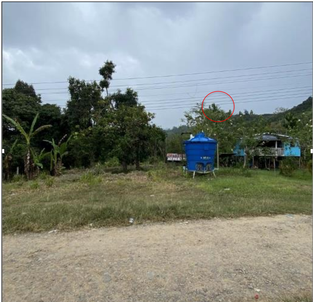
Gambar 3: Kawasan dibelakang rumah dipercayai mayat Kiyin diletakkan tanpa dikebumikan