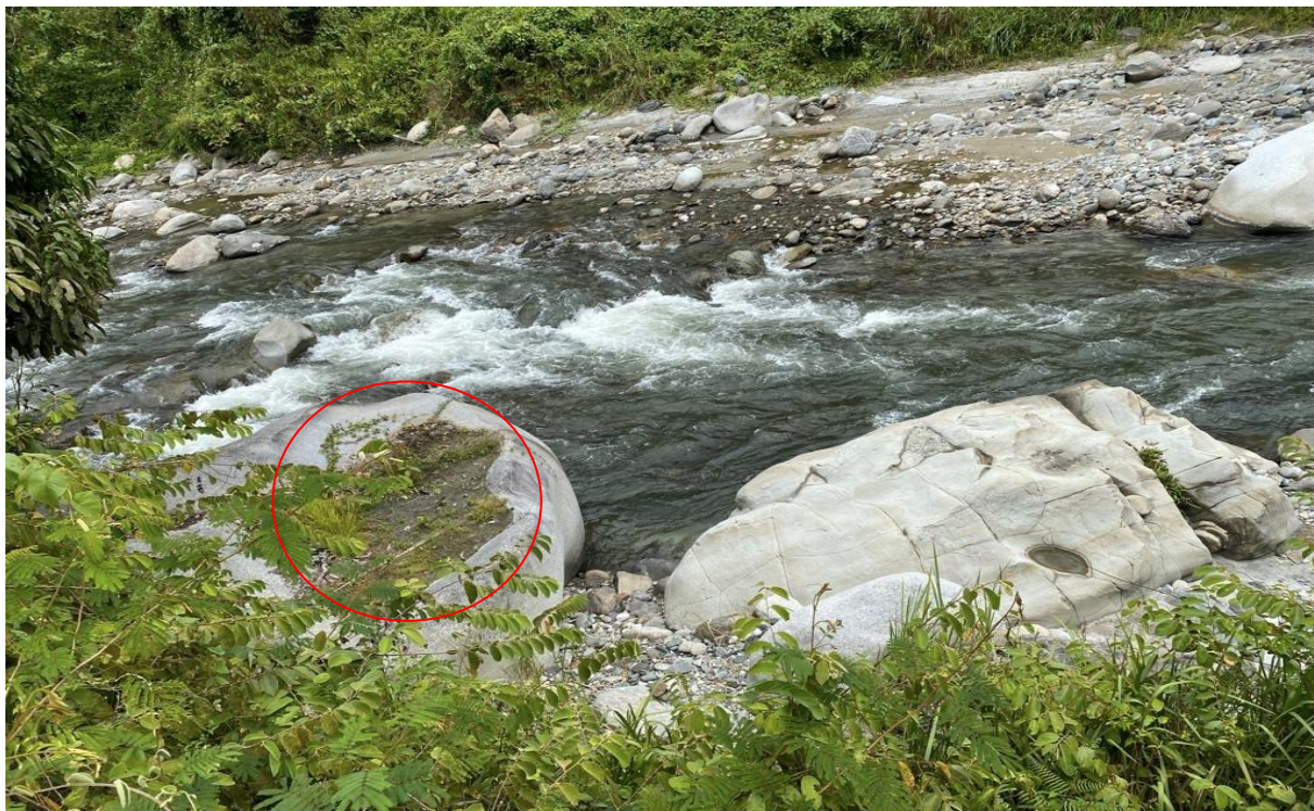
Gambar 2: Sungai di Kampung Nelumad